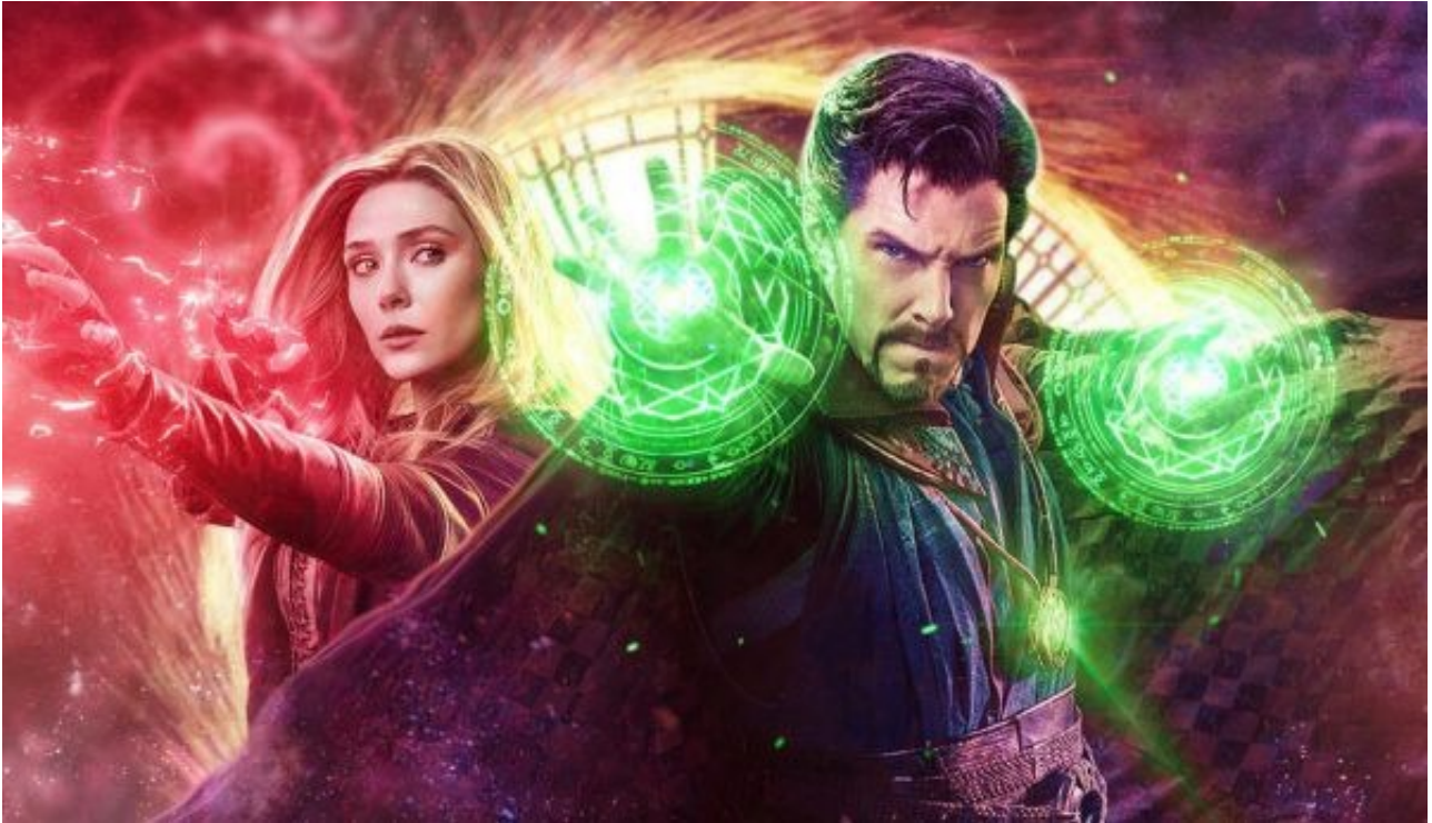
Multiverse of Madness

The Strange Doctor (Master of Mystic Equations)